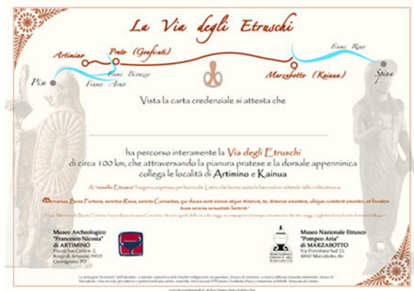
Esempio di attestato (" Sacculum " )

Sull'attestato viene riportato l'augurio, espresso per bocca dei Latini che hanno avuto la loro radice culturale nella civiltà etrusca: