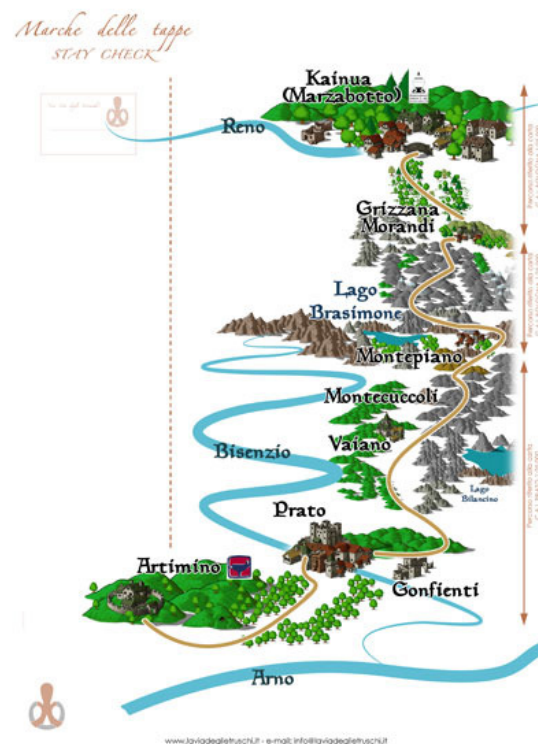
Esempio della Carta Credenziale

Riportiamo qui sotto due esempi dei documenti che i due musei dovranno fornire ad i viaggiatori che le richiederanno.