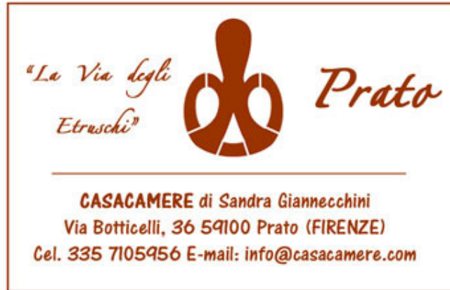
Esempio timbro di Casacamere

L' elenco di punti di convalida e logistici sono i seguenti: